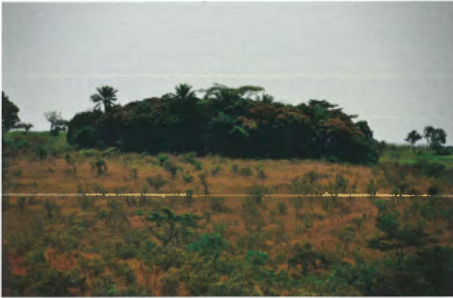
Ngongo Mbata, de heuvel waarop ooit een christelijke kerk stond