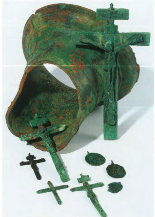
De klok samen met de kruisbeelden en het medaillon gevonden in een graf