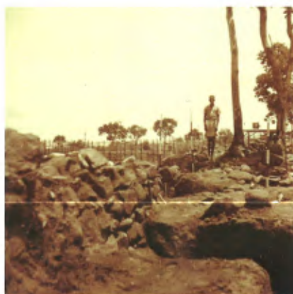
Opgravingen in 1938 door Maurits Bequaert © Koninklijk Museum voor Midden-Afrika

Het religieuze complex stond uiteraard niet op zichzelf. Om meer te leren over de volledige nederzetting Ngongo Mbata werden een zestigtal kleine sleuven gegraven op de zeventien hectare grote heuveltop. Daaruit blijkt dat het overgrote gedeelte van de heuvel bewoond was tussen de 16de en de 18de eeuw, met een concentratie rond en ten oosten van de kerk. Uit de sleuven kwamen verschillende types lokaal aardewerk en fragmenten van pijpen tevoorschijn, maar ook buitenlandse potscherven en enkele kralen. De exotische keramiek komt vooral uit Portugal — logisch, gezien de sterke banden tussen beide landen — maar ook uit Engeland, het Rijngebied en zelfs China. Eén van de kraaltjes is dan weer vervaardigd in Venetië. Een deel van het lokale aardewerk is ook niet afkomstig uit de directe omgeving van Ngongo Mbata, maar moet via de handelsroutes uit andere delen van het koninkrijk zijn aangevoerd. Ngongo Mbata had dus niet enkel lokale connecties, maar was als het ware opgenomen in een inter-