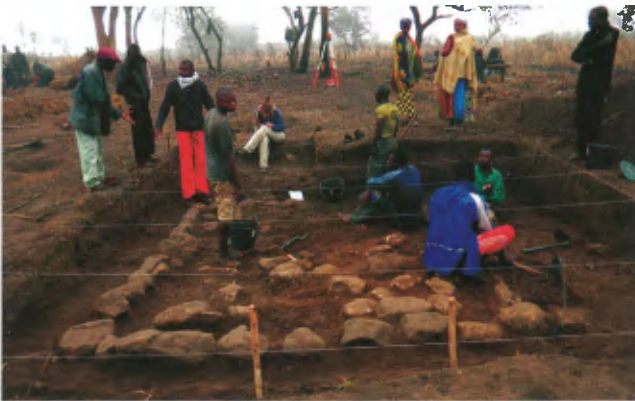
Archeologen graven de fundering van het kleine gebouw ten zuiden van de kerk op

Mbanza Kongo bestond het rijk uit verschillende provincies.