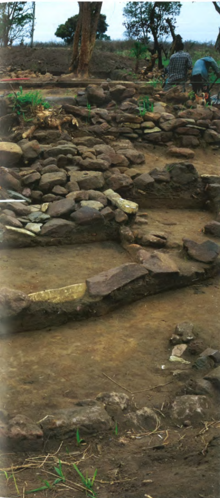
De opgegraven trappen die toegang gaven tot de kerk

We bevinden ons op een heuvel in het uiterste zuidwesten van de provincie Neder-Congo in de Democratische Republiek Congo. Het maakt deel uit van een plateau dat doorsneden wordt door de Inkisi, een rivier met bron in Angola. Je kan Angola bijna zien, al wordt het zicht belemmerd door de hoge grassen en het dichte struikgewas. In de valleien herinneren palmboomgallerijen je eraan dat je je niet zo ver ten zuiden van het tropisch regenwoud bevindt. Een verrassende plek om Belgische onderzoekers te vinden. De vorsers graven er niet enkel op, maar zoeken ook naar oude verhalen en legenden om zo het verleden van het vergeten Koninkrijk Kongo opnieuw te reconstrueren.