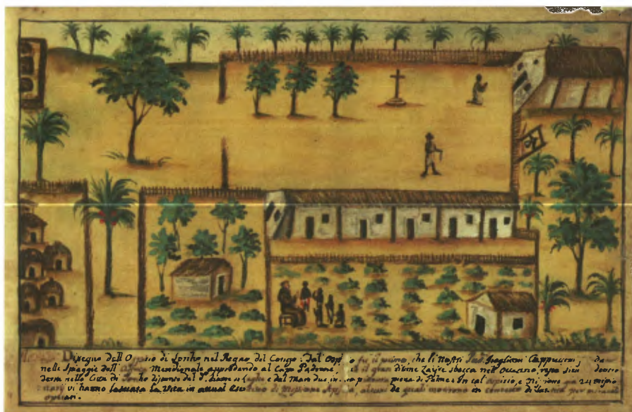
Aquarel van de missiepost in Mbanza Soyo in de 18de eeuw uit het manuscript van Bernardino Ignazio da Zezza d'Asti © Setore Sistema Bibliotecario Urbano De La Citta Di Torino

archeologie om de oorsprong en de vroege geschiedenis van het Koninkrijk Kongo beter te begrijpen. Archeologische gegevens laten toe historische informatie uit verschillende bronnen te toetsen. Een belangrijke rol is dus weggelegd voor plaatsen als Ngongo Mbata, dat vanaf de late 16de eeuw in verschillende documenten vermeld werd en ook voorkomt op 17de-eeuwse kaarten.